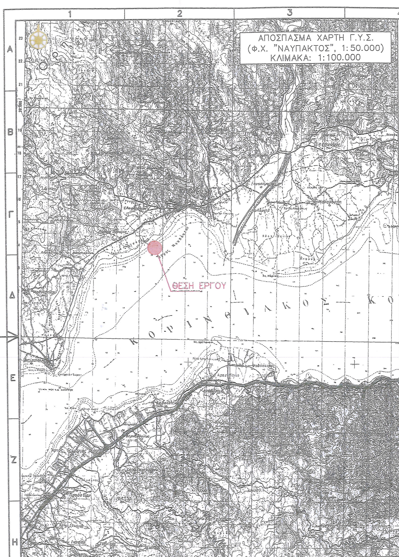
ΑΠΟΣΠΑΣΜΑ ΧΑΡΤΗ Γ.Υ.Σ. (Φ.Χ. "ΝΑΥΠΑΚΤΟΣ", 1:50.000) ΚΛΙΜΑΚΑ: 1:100.000