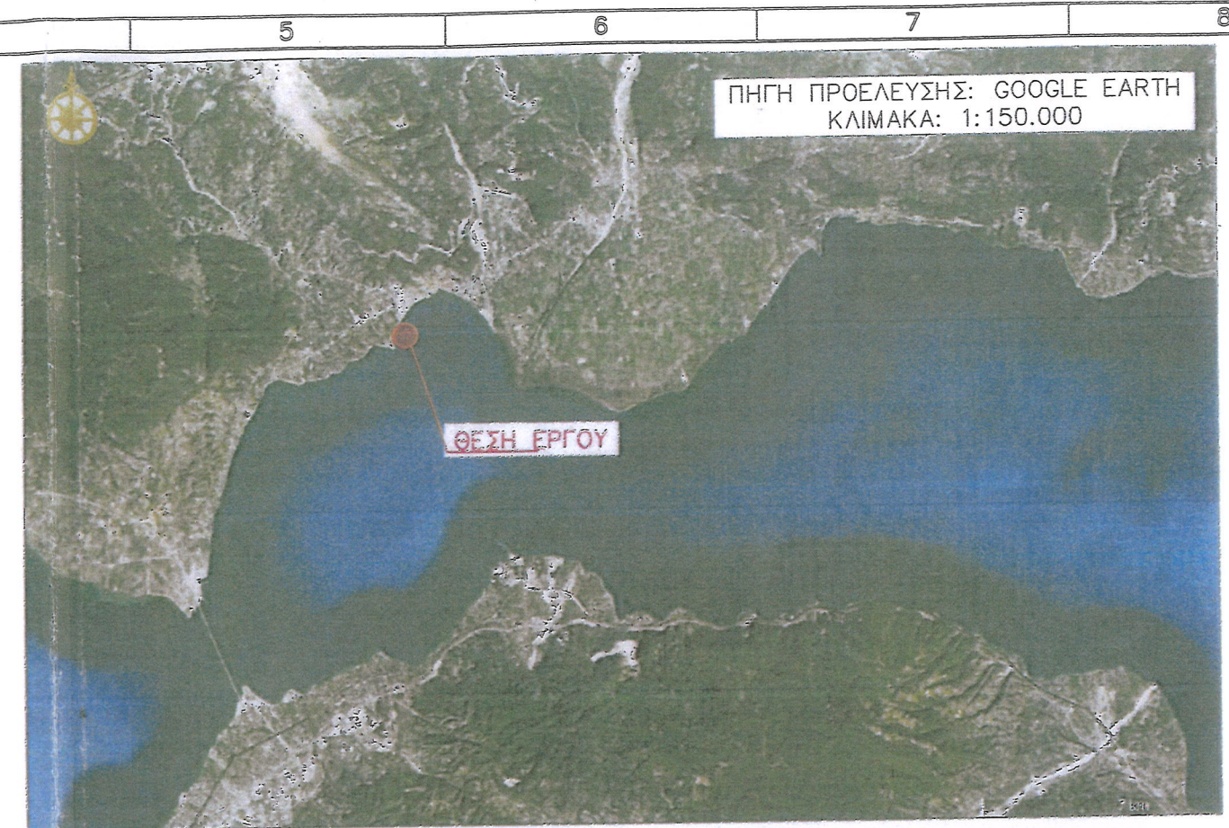
ΚΛΙΜΑΚΑ: 1:150.000